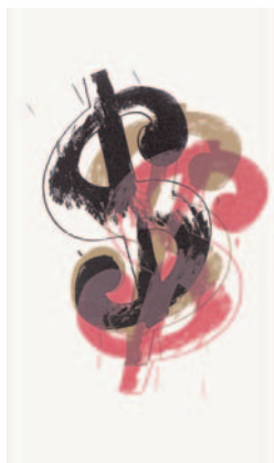
Andy Warhol Triple Dollar- Sign, 1982

Ebenfalls auf hohem Niveau ist die Pop Art mit Andy Warhol (mit dem Werk Triple Dollar-Sign von 1982, Preis auf Anfrage), Roy Lichtenstein, Keith Haring, Robert Rauschenberg und Tom Wesselmann auf dem Stand der Auden Galerie aus Bad Homburg (an einem Gemeinschaftsstand mit Global Art Affairs aus New York) eindrücklich vertreten. Die beiden Galerien stellen zusätzlich mit "Personal Structures" minimalistische Arbeiten von 16 Künstlern aus 11 Ländern im